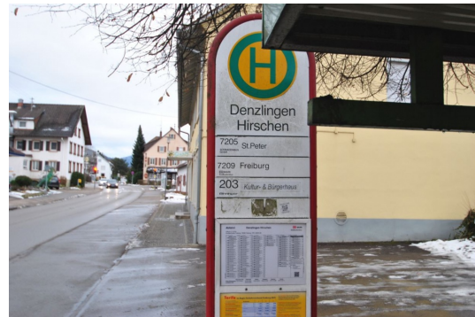
10m vom Hause