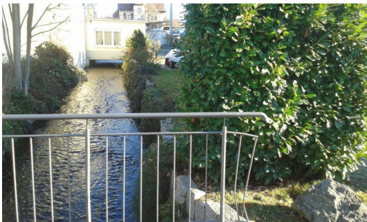
Idyllischer Bachlauf am Grundstück