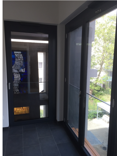
Das markante Herz des Bauwerks blieb weitestgehend erhalten.