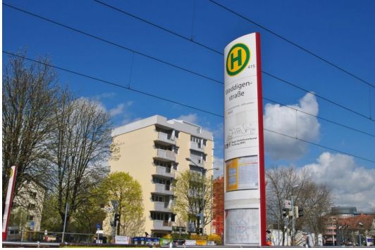
Einige wenige Schritte vom Hause