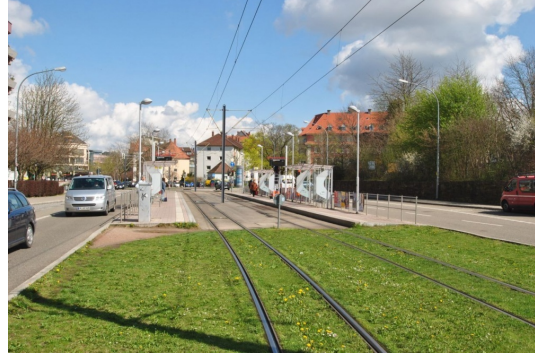
In 5min zur Stadtmitte und Uni