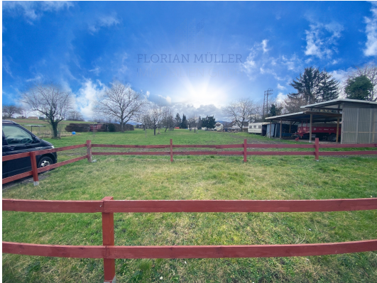
Hinter den Gärten