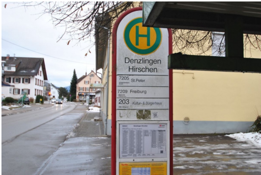
10m vom Hause