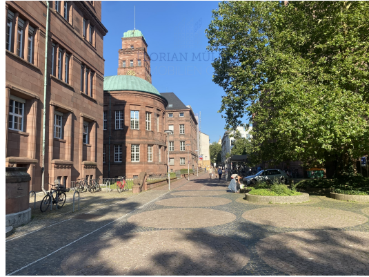
100m KG I+II