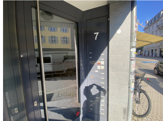
Alles in der Nähe