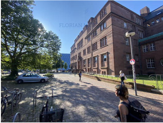
100m KG I+II