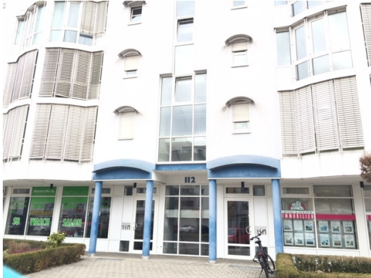
Gesuchte Lage mit hohem Freizeitwert