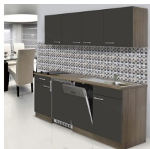
bestellte Einbauküche Respekta grau