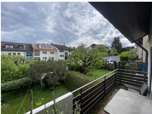
Blick über die Gärten