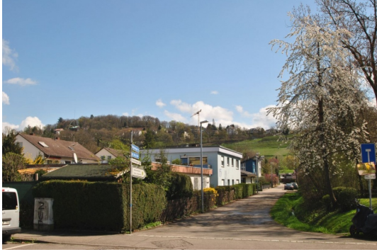
Vor der Haustüre gleich los spazieren und den Schlierberg genießen