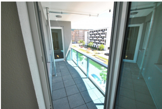
Abb. von ähnlicher Wohnung im Neubau