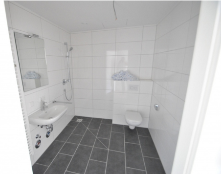
Abb. von ähnlicher Wohnung im Neubau