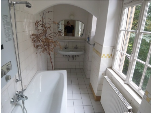
Alle Bilder sind Beispiele aus der Whg. 1.OG