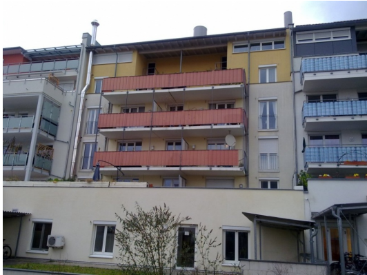
2010_11_24_R 41 Balkone - Kopie