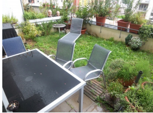
2010_11_24_R 41 Balkone - Kopie