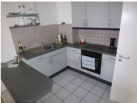
Inkl. Einbauküche Abb. ähnlich