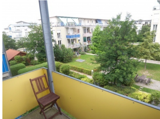
Balkon zur ruhigen Gartenseite