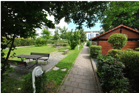
Gartenanlage mit Müll- u. Fahrradhäuschen