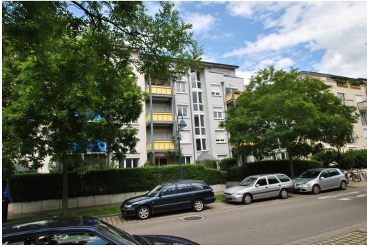
Alle Geschäfte u. Straba eine Querstraße weiter