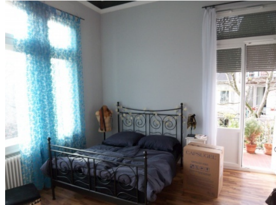
Schlafzimmer mit Balkon