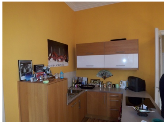
EBK offen zum Wozi