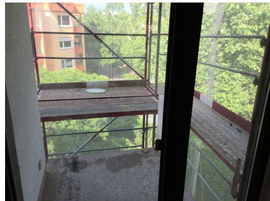
Balkon noch mit Baugerüst